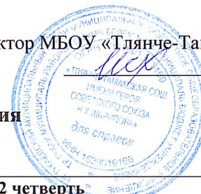
График оценочных процедур на уровне основного общего образования 2023-2024 учебный год за 1 полугодие